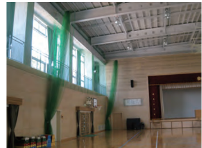
▲ロープ操作式（ステージ前、センター） 固定式（サイド、サイド上部）