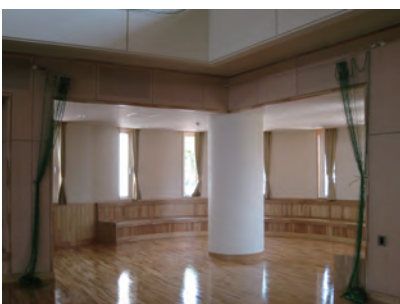
▲手引き操作式（出入口） 収納状況