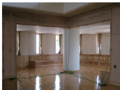
▲手引き操作式（出入口） 使用状況