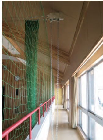
▲チェーン操作式（センター） 固定式（サイド）